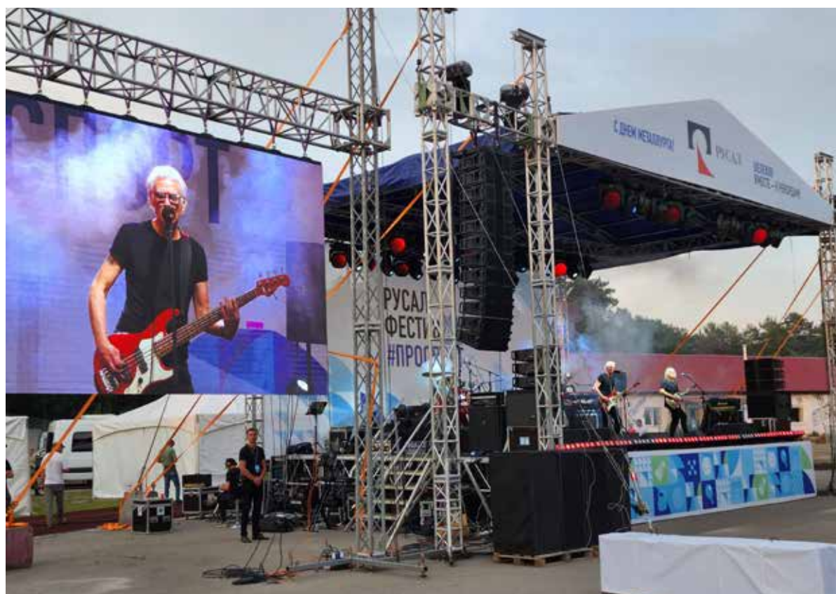
Концерт Александра Маршала