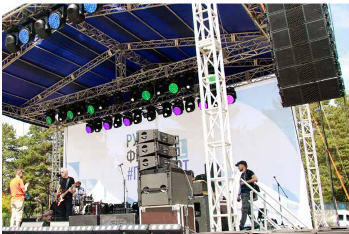
Концерт Александра Маршала